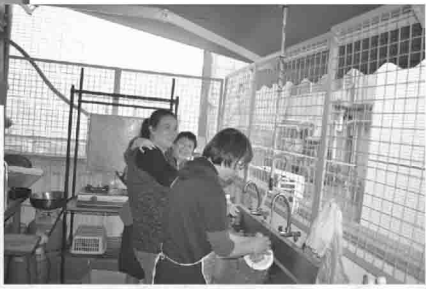
同心協力預備愛筵