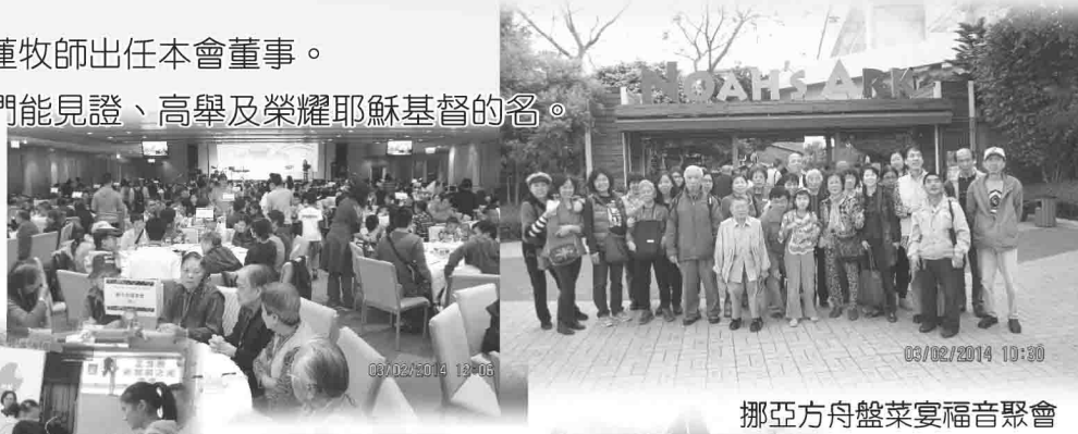
挪亞方舟盤菜宴福音聚會