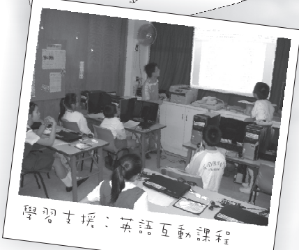
學習支援：英語互動課程