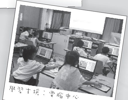
學習支援：電腦中心