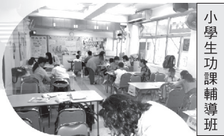
小學生功課輔導班