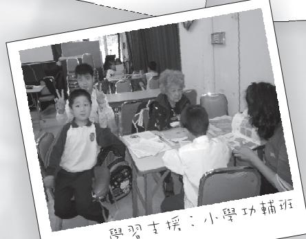
學習支援：小學功輔班