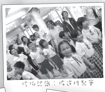
信仰認識：佈道性聚會