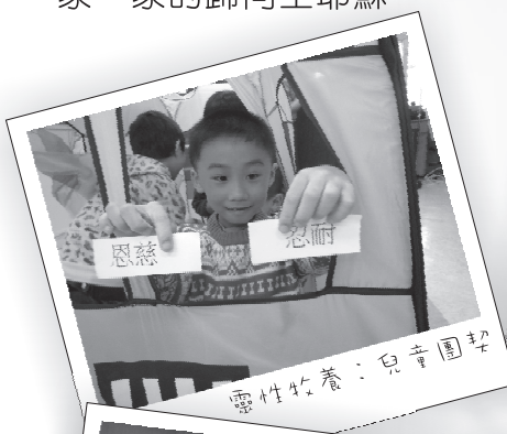
靈性竹養：兒童團契