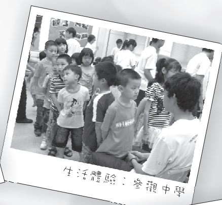
生活體驗：參觀中學