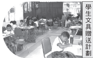
學生文具贈送計劃