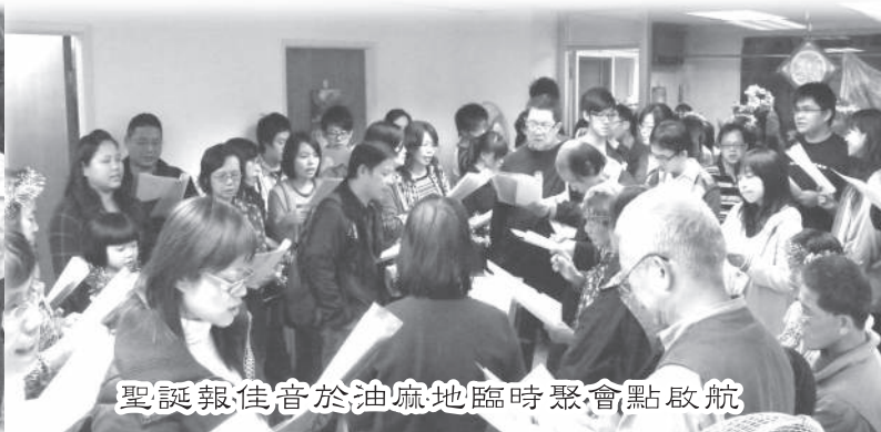
聖誕報佳音於油麻地臨時聚會點啟航