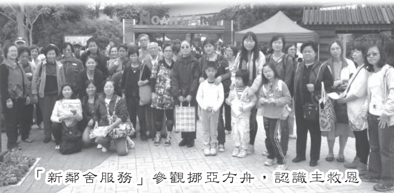
「新鄰舍服務」參觀挪亞方舟，認識主救恩