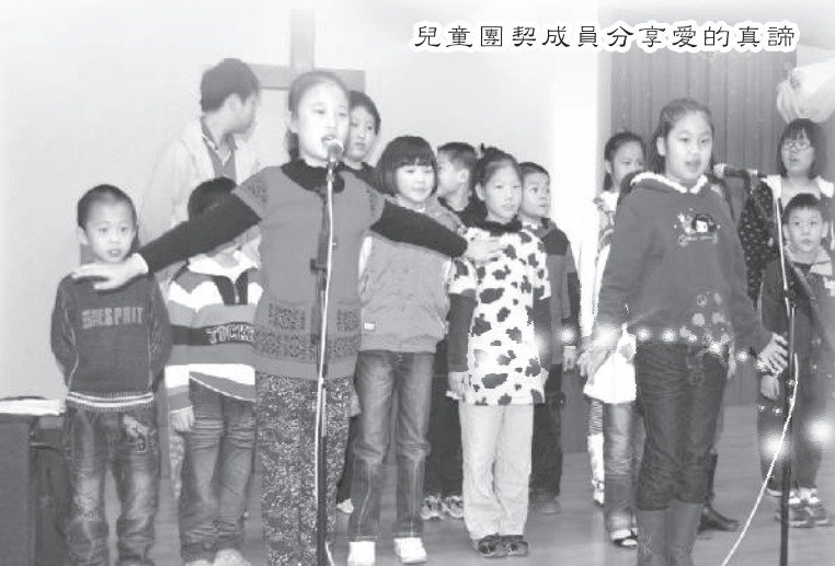
兒童團契成員分享愛的真諦

感謝神「榕光」起初像「沙漠開花」，廿三年前無人、無地方，在榕樹頭公園佈道，經過我們接觸關顧，帶領他們認識福音，信靠耶穌，建立一所基層教會。除崇拜外，我們更透過查經班、團契、學習、彼此相愛，在真道上一同成長。現在總受洗會友人數約320名，但他們大部份是獨居老人、露宿者、染癩好者、精神病康復者、危機中的孤兒寡婦。因此，本會未能在經濟上自立，會友大都是靠綜援生活。我們借用油麻地社區中心聚會已廿多年了。去年6月份因社區中心有政府部門優先借用，故不能給「榕光」作聚會用。油麻地會友很迫切為地方呼求神，祈求