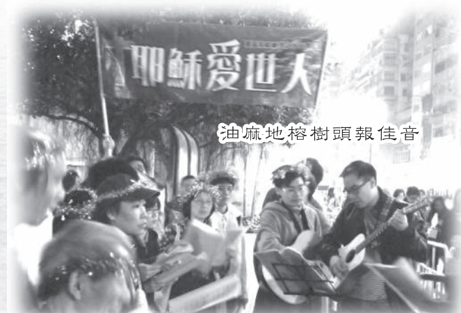
油麻地榕樹頭報佳音