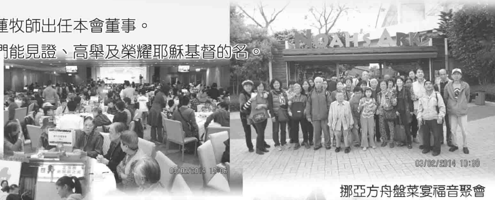
挪亞方舟盤菜宴福音聚會