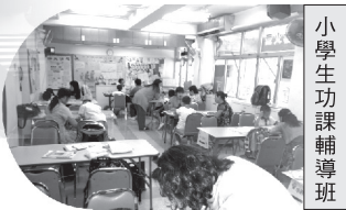
小學生功課輔導班